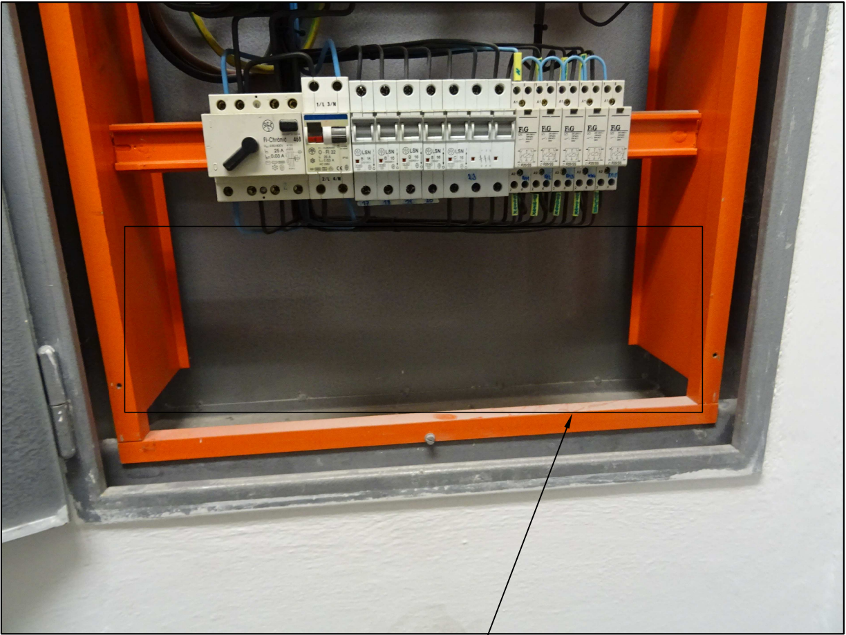
Volný prostor k instalaci DIN lišty a nových přístrojů

Napětová soustava: 3 PEN, 230/400V, 50 Hz, TN-C-S Základní ochrana: izolaci dle ČSN 33 2000-4-41 kryty a přepážkami dle ČSN 33 2000-4-41 ed.3 Ochrana při poruše: automatickým odpojením od zdroje dle ČSN 33 2000-4-41 ed.3 Doplňková ochrana: proudovým chráničem dle ČSN 33 2000-4-41 ed.3 ochranným pospojováním dle ČSN 33 2000-4-41 ed.3